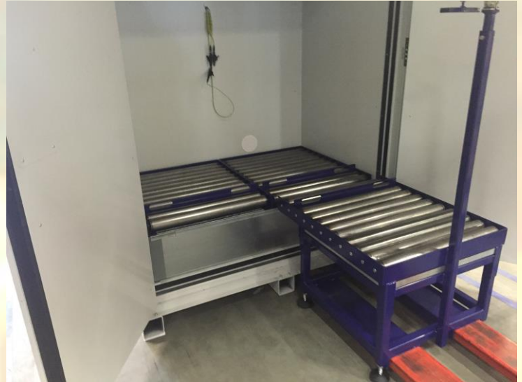
Transporttafel met rollers en rolelementen in de kast

Voor plaatsing in de kast worden een dubbel rolelement mee geleverd. Het rolelement kan direct op het rooster van de opvangbak worden geplaatst. Elk rolelement is voorzien van een beveiliging in de rollers, zodat een vat niet onverwachts van de rollers kan aflopen.