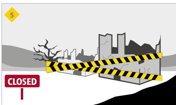
la destruction des locaux et l'arrêt des activités