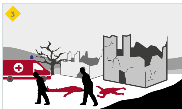
ce qui provoquera des blessés, des morts