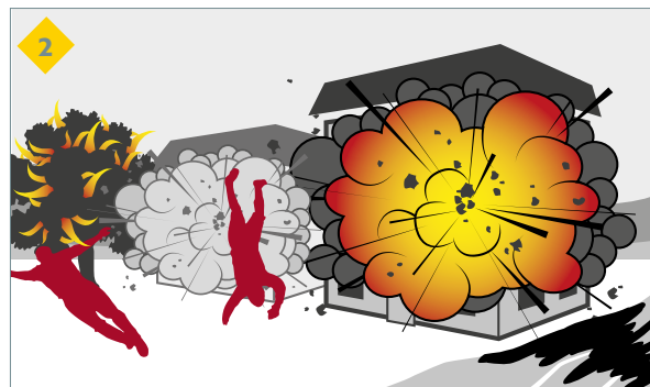
le stockage de produits inflammables provoquera une propagation rapide du feu mais surtout des explosions