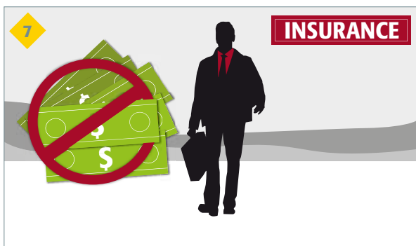
et les compagnies d'assurance refuseront de verser toute indemnité