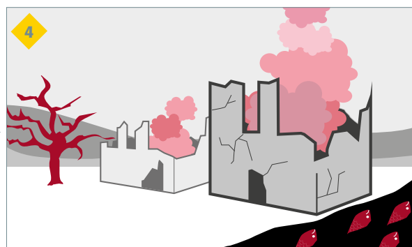
des dommages sur l'environnement