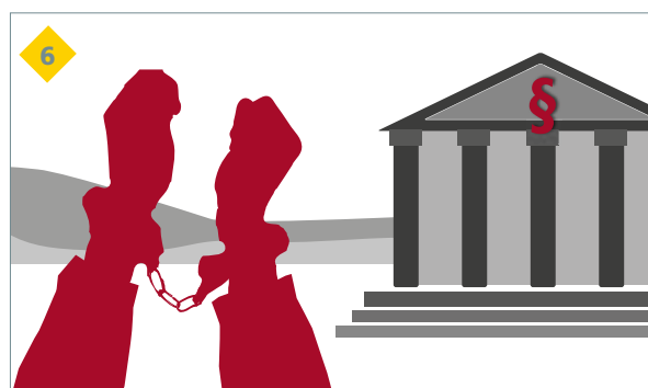
des conséquences juridiques