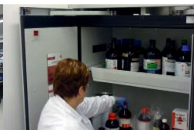
Charles Perkins Centre Australie