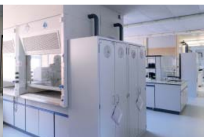
Université Sussex Angleterre