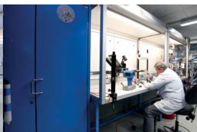
Endress + Hauser Suisse