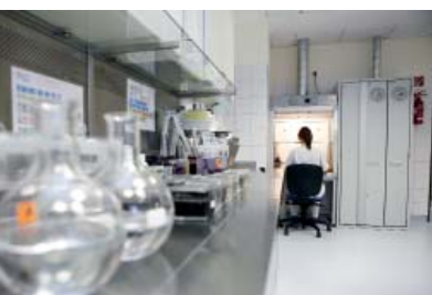
Clinique de Fulda Allemagne

☎ +33 (0)3.87.78.62.84 » c.kurdykowski@asecos.fr