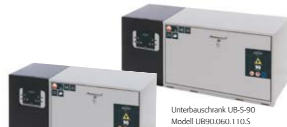
Unterbauschränk UB-S-90, Modell UB90.060.089.S