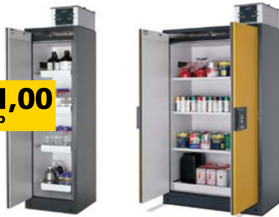
Sicherheitsschrank Q-PEGASUS-90, Modell Q90.195.060.WDAC

Diese 360° Miet-Modelle stehen zur Verfügung: