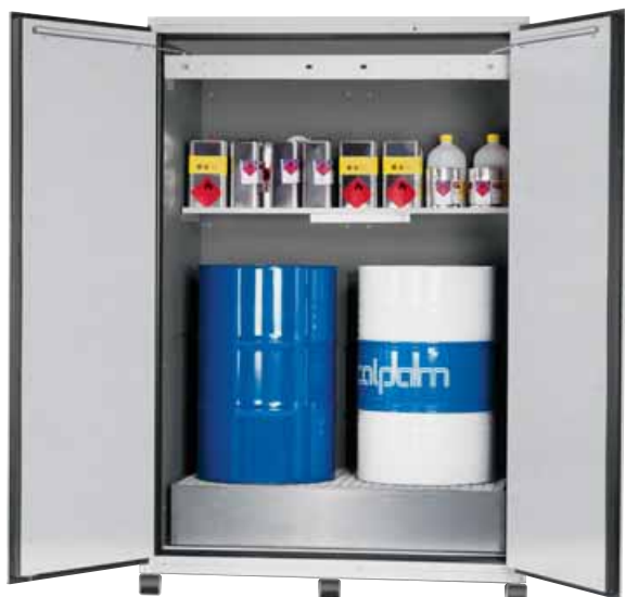
Model VBF.221.153-F Bestelnr. 11-1209 A: met transportprofielen, opvangbak, verzinkt rooster en legbord, kleur lichtgrijs