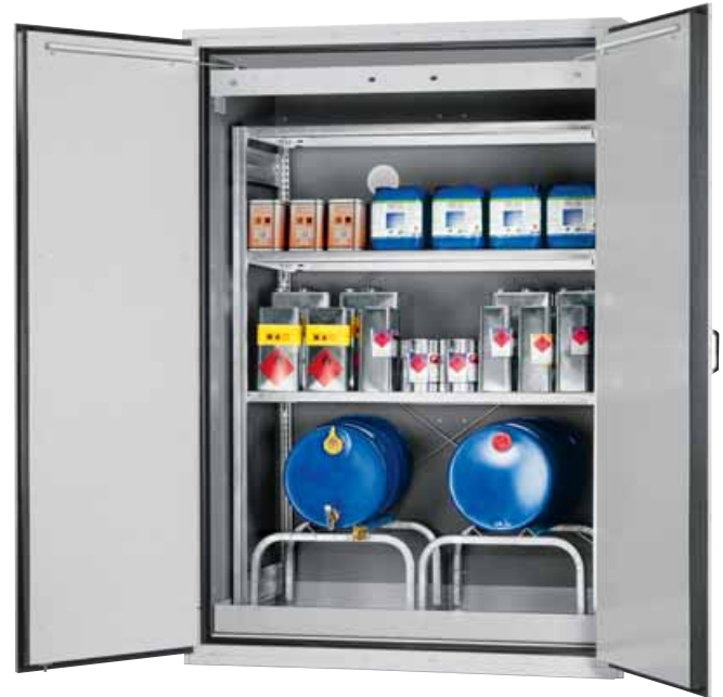
Model VBF.221.153-FR2 Breedte van de kast 1555 mm, met verstelbaar stelsysteem (pag. 63).