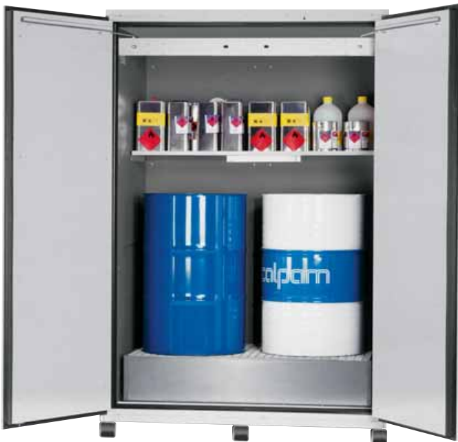
Model VBF.221.153_F Breedte van de kast 1555 mm (pag. 63).