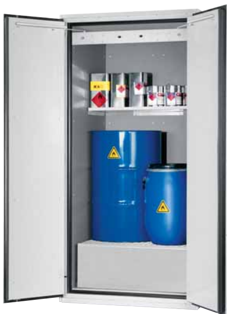
Model VBF.221.108-F Bestelnr. 11-1207 A: met opvangbak, verzinktrooster en legbord, kleur lichtgrijs