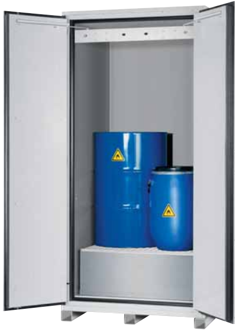
Model VBF.221.108 Breedte van de kast 1105 mm (pag. 62).