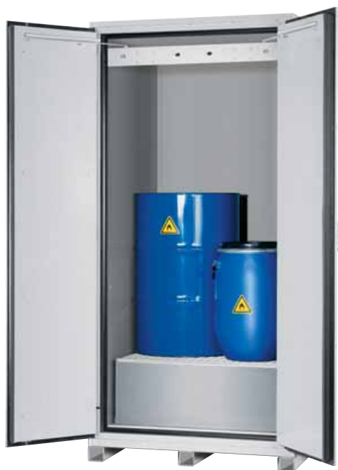
Model VBF.221.108 Bestelnr. 11-1261 A: met transportprofielen, opvangbak, verzinkt rooster, kleur lichtgrijs