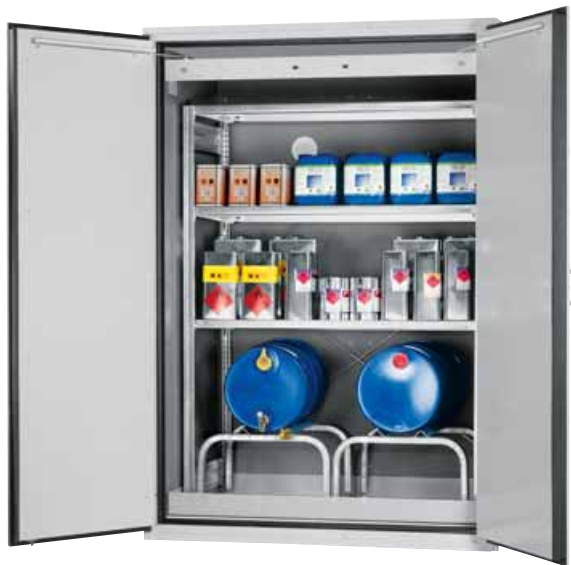
Model VBF.221.153-FR2 Bestelnr. 11-1210 A: met opvangbak en stellingstelsysteem, kleur lichtgrijs