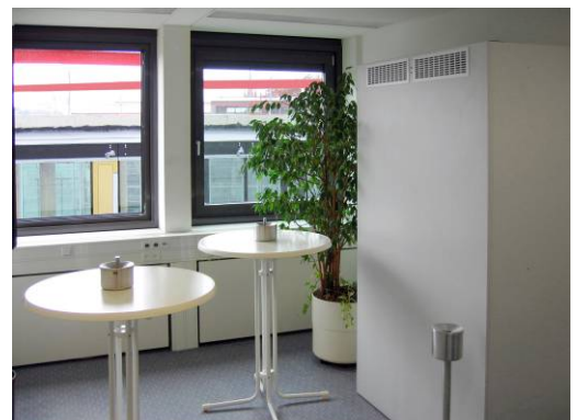
Luftreiniger XXL in einem Raucherraum