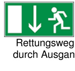
Rettungsweg durch Ausgang