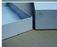
detailfoto: vloeistofdichte legborden en bodemopvangbak