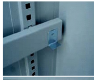
detailfoto: solide ophanging en vergrendeling van opvanglegborden