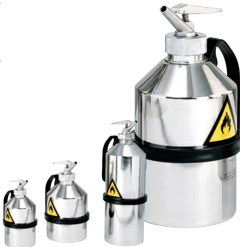
Récipients de sécurité en acier galvanisé verni, capacité 1, 2,5 et 5 l